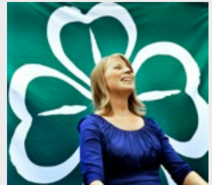
Ansvarigt statsråd, Annie Lööf (c)