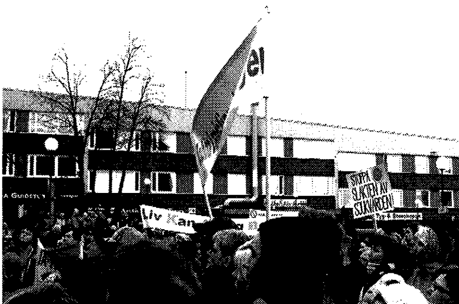
Arbetarrörelsen är splittrad. Det kom cirka 3 000 till demonstrationen, men det rådde en total brist på organisering. Detta är symptomatiskt för närmast hela världen idag.

De två största politiska traditionerna i arbetarrörelsen har antingen gått under (kommunismen) eller kraftigt försvagats och förborgerligats (socialdemokratin). Återstår gör ett växande ledarskapstomrum där till och med nationalistiska högerpartier som Sverigedemokraterna kan kliva fram och vinna arbetarsympatier. Det bäddar för farliga politiska kriser och okontrollerbara situationer. Klassmotsättningarna minskar inte för att arbetarrörelsens politiska ledarskap har krympt och blivit maktlöst. Tvärtom ökar spänningarna i takt med att de rika blir rikare och de fattiga blir fattigare; i takt med att exploateringen av människor och natur blir allt rårare.