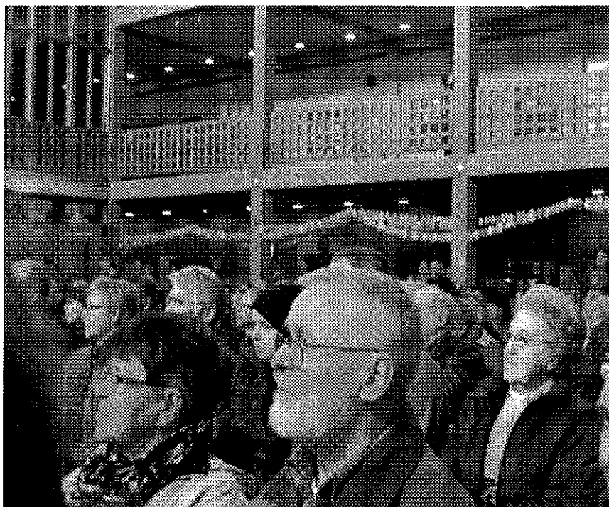
Hamnade alla dessa människor mellan stolarna?

Landstingets jakt på kostnader leder till att verksamheter ställs mot varandra – istället för ett fokus på befolkningens vårdbehov, personalens kompetens och arbetsmiljö. De senaste 10 årens privatiseringspolitik har öppnat för skapandet av stora vårdkoncerner som agerar på hela den europeiska kontinenten, ofta med riskkapitalister i spetsen. De köper sjukhus, öppnar vårdcentraler och privatklinikker som sätter ytterligare press på den offentliga sjukvården att stå sig på den nya